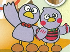
埼玉県のマスコット コバトンとさいたまっち