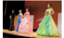
▲ ファッションショー