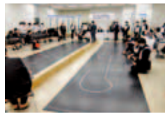
▲ ロボット競技コース