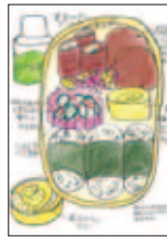
▲ アイデア弁当原画（昨年度の教育長賞）